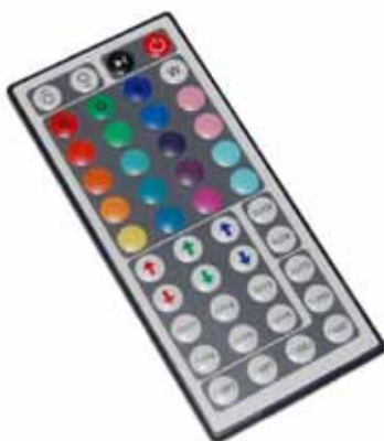
CONTROLADOR POR INFRARROJOS 44 BOTONES (IR44) Controlador por Infrarrojos IR de 44 Botones 12V DC, 3A por canal. Dimensiones: 120 X 55 X 7