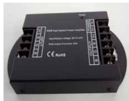
AMPLIFICADOR DE SEÑAL RGB 30A (ASRGB30A)

Mini Amplificador de Señal RGB 12V DC, 12A, 144W Dimensiones: 40 X 15 X 5