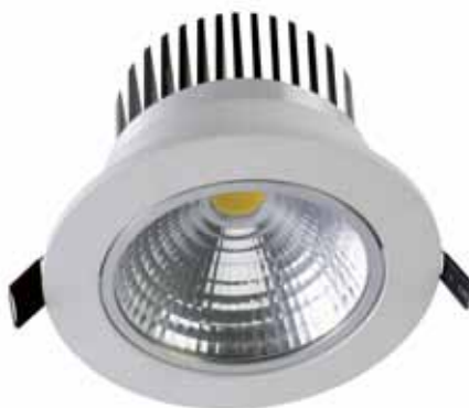
DOWN LIGHT 15W (DL15WBC)