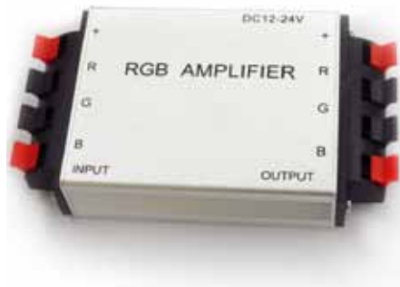
AMPLIFICADOR SEÑAL RGB (ASRGB12A)

Bombilla led par 38 - E27 de 21w Blanco calido