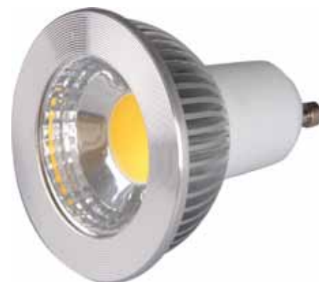
BOMBILLAS COB LED GU10 5 W (BCOBGU105W)