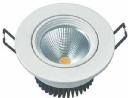
DOWN LIGHT 5W(DL5WBC)