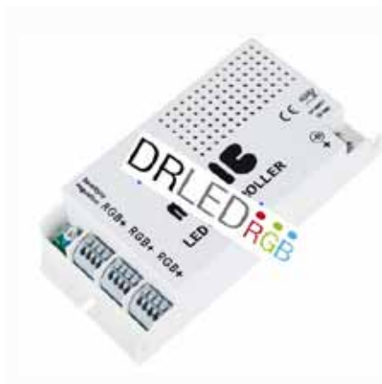
CONTROLADOR IR24 POR MUSICA (IRM24) Controlador por Musica y Infrarrojos IR de 24 Botones 12V DC, 3A por canal Dimensiones: 85 X 50 X 7