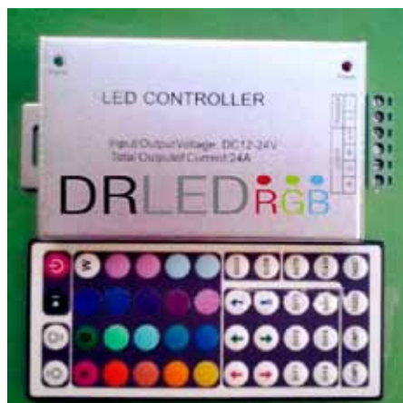
CONTROLADOR POR INFRARROJOS 48 BOTONES 8A (IR488A) Controlador por Infrarrojos IR de 48 Botones 12V DC, 8A por Canal Dimensiones: 120 X 55 X 7