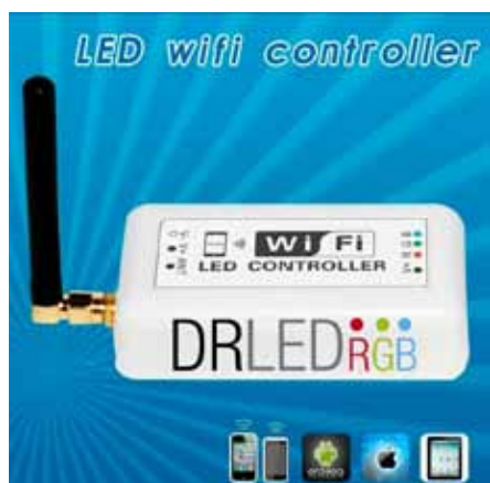
CONTROLADOR WIFI MOVIL (CWIFI) Controlador WIFI Compatible con Androud I Apple 12V DC, 3A por canal Dimensiones: 150 X 90 X 50