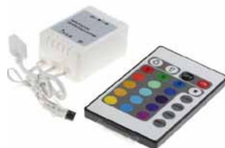
CONTROLADOR POR INFRARROJOS 24 BOTONES (IR24) Controlador por Infrarrojos IR de 24 Botones 12V DC, 3A por canal. Dimensiones: 85 X 50 X 7