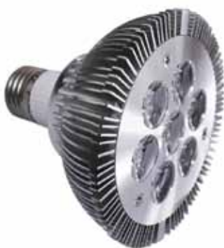
BOMBILLA LED PAR 38 - E27 DE 21W BLANCO CALIDO(BPAR38E2721W)

Tubo led smd T8 150mm 25w (disponible 120 y 60 mm)