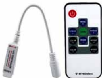
CONTROLADOR POR INFRARROJOS 10 BOTONES (IR10) Controlador por Infrarrojos IR de 10 Botones para 1 color 12V DC, 3A por canal. Dimensiones: 85 X 50 X 7