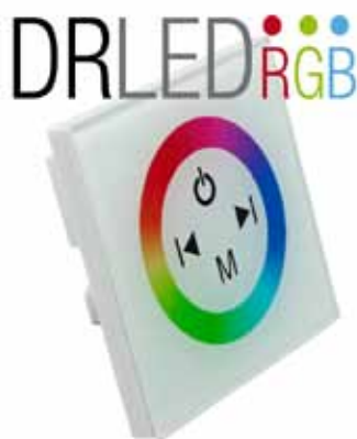
CONTROLADOR EMPOTRABLE TACTIL (CET) Controlador Empotrable Tactil 12V DC, 3A por Canal Dimensiones: 90 X 90 X 40