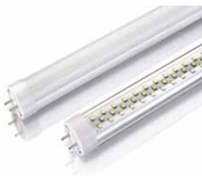
TUBO LED T8 150MM 25W(TLEDT8150MM25W)

Tubo led smd T8 150mm 25w (disponible 120 y 60 mm)