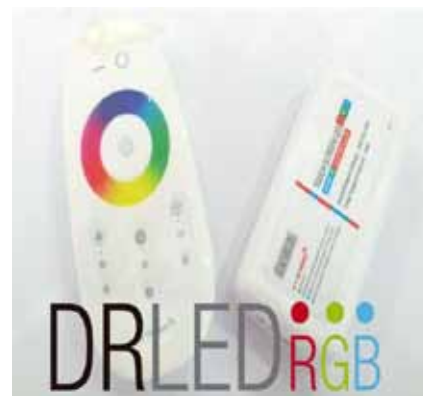
CONTROLADOR RADIOFRECUENCIA TACTIL (CRFT) Controlador por Radiofrecuencia RF Tactil 12V DC, 3A por canal Dimensiones: 100 X 60 X 35