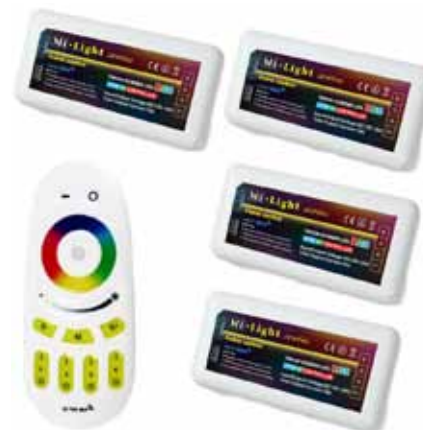
CONTROLADOR RADIOFRECUENCIA 4CANALES (CRFT4C) Controlador por Radiofrecuencia RF Tactil 4 Canales 12V DC, 3A por canal Dimensiones: 100 X 60 X 35

PROVEEDOR DE ILUMINACIÓN LED AL MEJOR PRECIO. IMPORTAMOS DIRECTAMENTE DESDE EL FABRICANTE Y DISTRIBUIMOS AL POR MAYOR Y AL CLIENTE FINAL POR INTERNET CON LOS MEJORES PRECIOS DEL MERCADO.