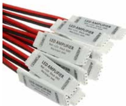
MINI AMPLIFICADOR DE SEÑAL (MASRGB12A)

Amplificador de Señal RGB 12V DC, 12A, 144W Dimensiones: 70 X 60X 100